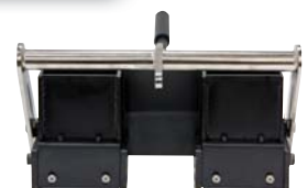
4 in x 4 in x 4 in SmartDie II

Durch die große Auswahl an Gießvorrichtungen lassen sich durchgehende Linien (5-30 cm), unterbrochene Linien und Doppellinien (mit Doppellinien-Ziehschuh) erstellen. Mithilfe von Schablonen können Beschriftungen, Stopp- und Warnschilder erzeugt werden.